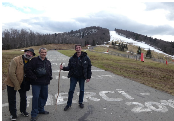
S'était notre dernière sortie juste avant la fermeture. Quelques braves ont tenté l'ascension de la planche des belles filles. Le 14 mars