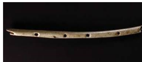
Flûte de la grotte de Hohle Fels (Allemagne)