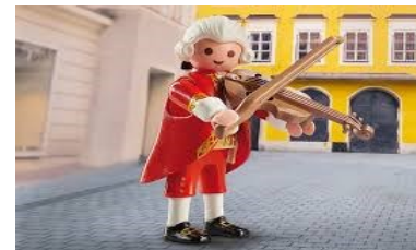
W.A.Mozart (en playmobil)